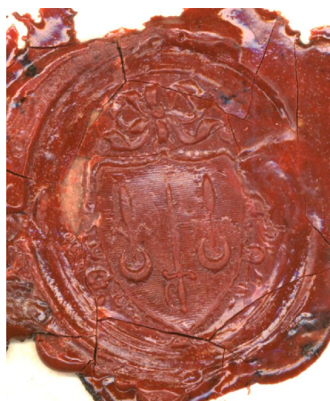
Deux épées posées en pal