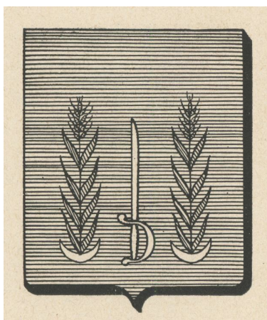
Godefroy de Tonnancourt